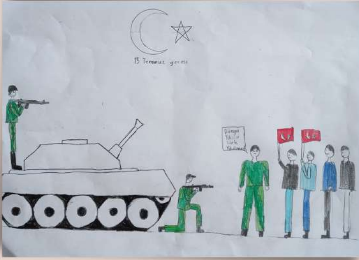
Elif Azra AKDOĞAN 2/E