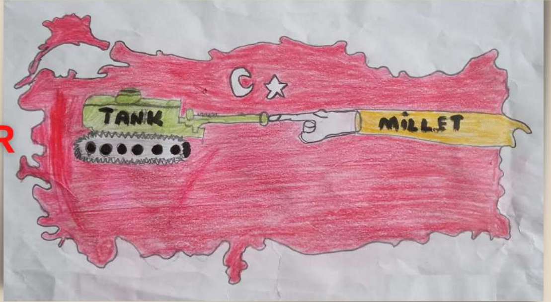
Ela TÜRKER 2/E